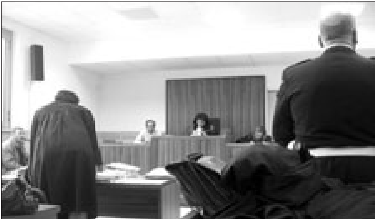
L'aula del tribunale di Gaeta

fissare un appuntamento andarono vani. Dei soldi poi nemmeno più l'ombra... «Scoprimmo poi tutti i guai che aveva combinato...». Il teste ha confermato in aula anche di avere scoperto che sul suo conto