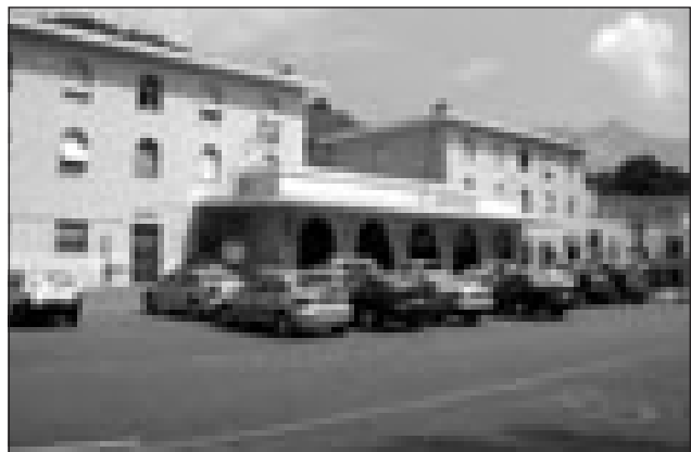
La stazione ferroviaria

E' scontro tra gli autisti del Cotral Spa di Gaeta e di Minturno Parchi e l'amministrazione comunale di Formia per il trasferimento del capolinea degli autobus presso il molo Vespucci. Da una parte gli autisti hanno inviato una nota al Prefetto, nella quale lamentano grossi disagi per l'ordinanza del Comune, che, emessa a causa dei lavori sul ponte della Flacca, è tuttora in vigore. «L'ordinanza ha provocato scompiglio tra i cittadini che usufruiscono del servizio di trasporto pubblico Cotral Spa. Tale situazione, oggi non è più sopportabile, anche perché ci usano come oggetti e non come persone aventi responsabilità proprie e verso i terzi. A tal proposito abbiamo convocato da subito la commissione aziendale responsabile della sicurezza sul lavoro, i cui componenti dopo il sopralluogo, hanno verbalizzato l'assenza di tutte le sicurezze in ambito delle normative 626