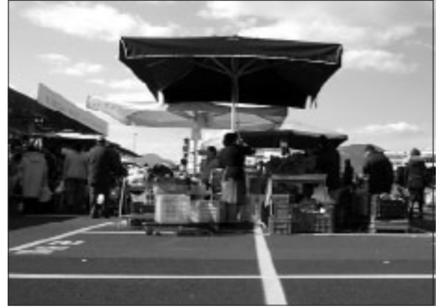
Un'immagine del mercato domenicale