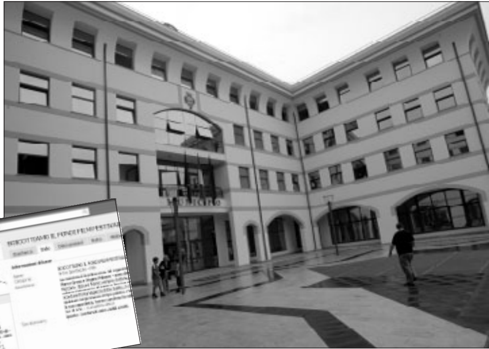
La schermata di Facebook e, sopra, il Comune di Fondi