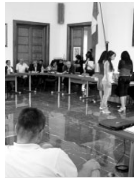
Il consiglio comunale di Sabaudia