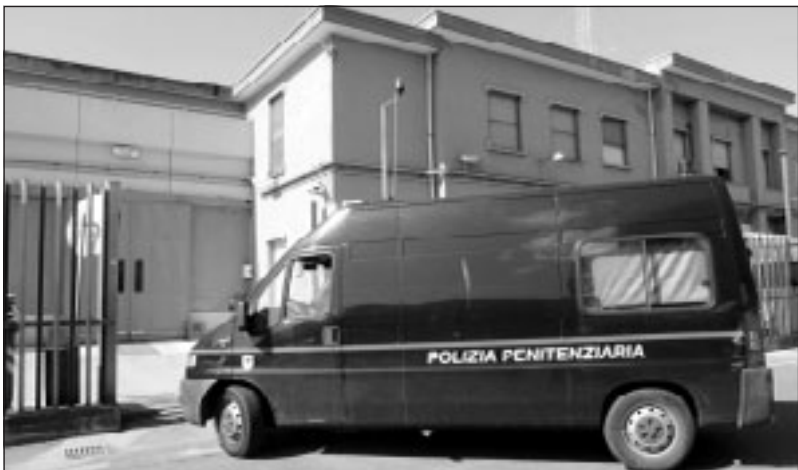
Il carcere di Latina dove si trova da sabato il serbo arrestato a Cori

Abbiamo sentito quindi il fratello della 43enne che ha voluto solo dire che «...adesso se lui - il 30enne serbo K.R. - non viene rimandato o riportato nel suo Paese vuol dire che qualcosa nel nostro ordinamento e nel nostro Paese non funziona».