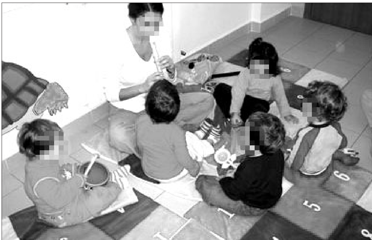
In commissione si stanno rivedendo i criteri per l'ammissione alle strutture comunali