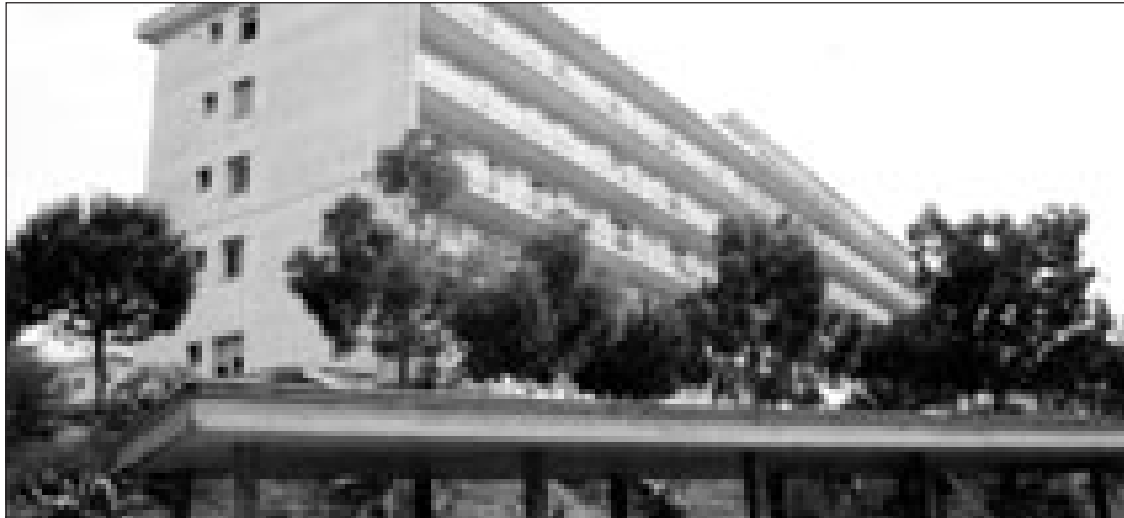
L'ospedale Dono Svizzero di Formia

Quindi alla grave situazione per la mancanza di biancheria per un paziente che deve ricoverarsi si aggiungono la scarsa qualità dei servizi forniti dalle ditte e la mancanza di risorse per l'aumento dei posti letto: il risultato di tutto ciò è la fuga del personale ospedaliero in strutture private locali o in altre strutture verso il nord della penisola.